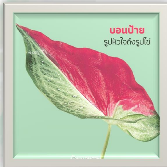
บอนสายชล(บอนป้าย)

ล้มลุกที่มีหัวใต้ดินเหมือนเผือก ชูกิ่งใบเหนือพื้นแบบ บัวหลวง ลักษณะใบรูปทรงหัวใจ รูปใบโพธิ์ มีทั้งทรงกลม ทรงรี และเรียวยาว รวมถึงสีสันของใบที่มีหลายสี ไม่ว่าจะเป็น สีเขียว สีแดง สีชมพู สีเหลือง สีขาว หรือ สีม่วง สลับกับลวดลายของใบที่ดูแปลกตา และมีความหลากหลายทางสายพันธุ์ มักถูกปลูกเป็นไม้ประดับ บอนสีมีมากกว่าร้อยสายพันธุ์ ทุกส่วนของบอนสีมียาง ที่อาจทำให้เกิดการระคายเคืองต่อผิวหนังได้