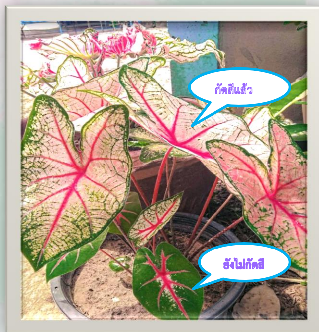
บอนเจ้ากรุงเดนมาร์ก (บอนกัตสี)

ปัจจุบันบอนสีที่นิยมปลูก มีอยู่ ๒ สายพันธุ์หลักๆ คือ บอนไทย เป็นสายพันธุ์ดั้งเดิมที่มีมาตั้งแต่สมัยก่อน เช่น อิเหนา ช้างเผือกใบบัว นางไหม สาวน้อยปะแป้ง นกกระทา เจ้ากรุงเดนมาร์ก ผีเสื้อชมพูฯ และบอนไทยที่มีการผสมสายพันธุ์มาเรื่อยๆจนได้พันธุ์ใหม่ๆ บอนจีน เป็นพันธุ์ที่นำเข้ามาจากจีน ซึ่งสายพันธุ์ที่นิยมและเห็นกันบ่อยๆตามตลาดต้นไม้ เช่น Strawberry Star หรือ New Wave